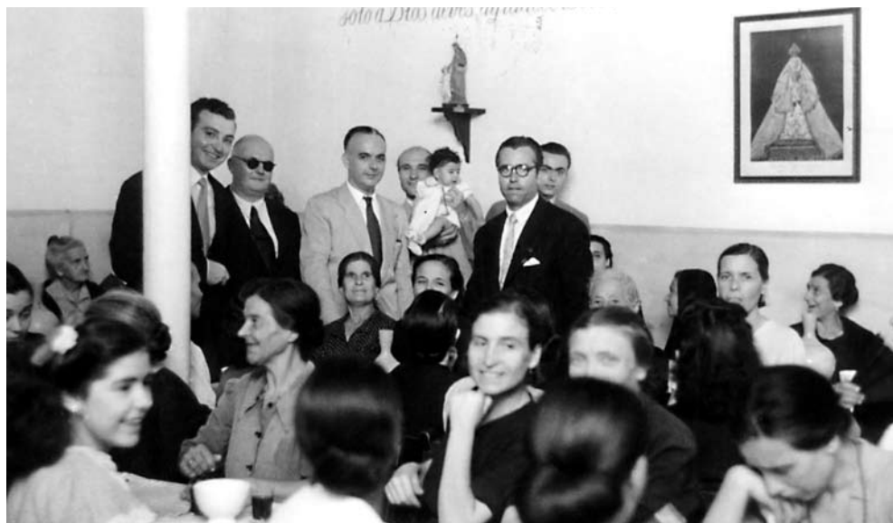
La Hermandad de Santa Marta, desde su fundación, realizó numerosos actos de ayuda a las personas más necesitadas, dentro de su amplio programa de ayuda social.