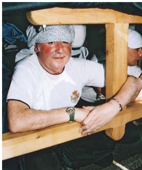
A la izquierda, el cardenal Amigo Vallejo, en su última Semana Santa, presidiendo la procesión de palmas. A la derecha, el pregonero de la Semana Santa 2009, Enrique Henares, costalero en las Cigarreras.