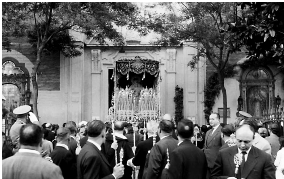
La Hermandad de la Estrella de Triana, que celebra 450 años de historia, en una salida extraordinaria desde San Jacinto, con motivo del IV centenario.