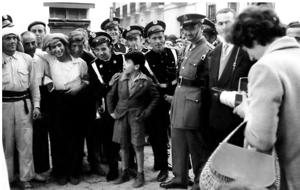
La sorprendida turista quiere captar con su máquina a los costaleros y músicos de la Hermandad de la Candelaria, en los momentos previos a la salida de la Iglesia de San Nicolás