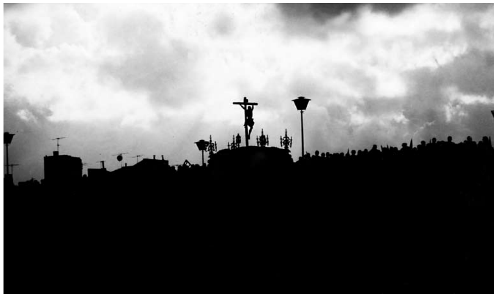
Portentosa imagen del Cachorro por el Puente de Triana. Es una fotografía del recordado reportero Ángel Gelán, de la mitad del siglo XX. Impresionante contraluz del paso del Crucificado del templo del Patrocinio.