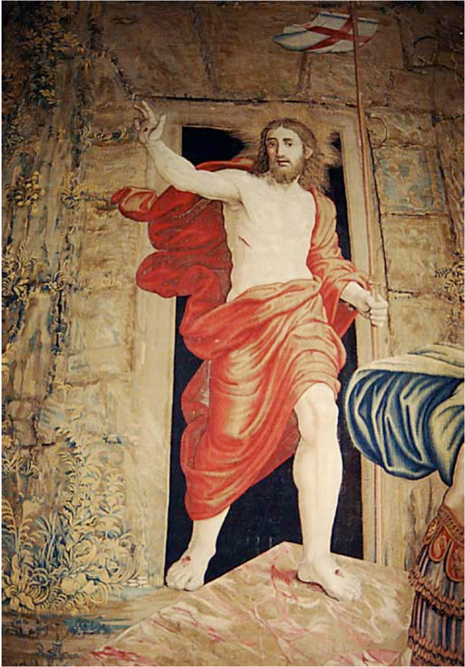
SEMANA SANTA Sevilla, 2010