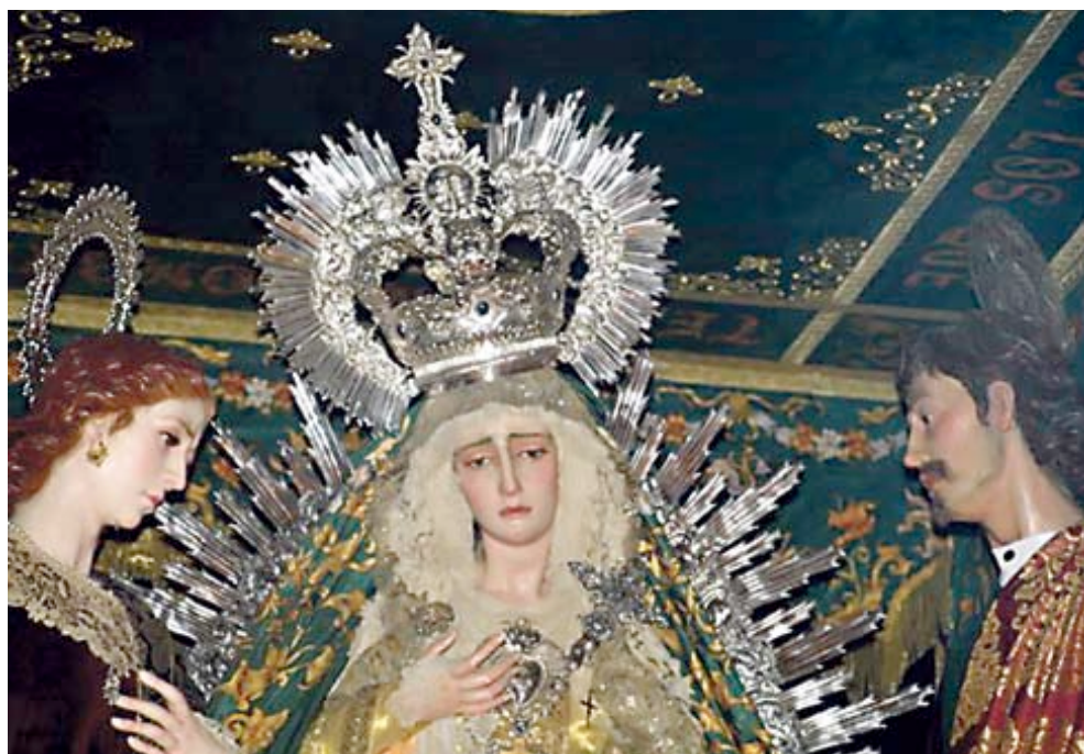
La Hermandad del Sol se incorpora, como la cofradía número sesenta, a la carrera oficial. Saldrá en procesión el Sábado Santo. En el paso de palio lleva la Sagrada Conversación, con la Virgen, San Juan y la Magdalena.

Pero en este milenio, la gente con ganas de cofradías podrá participar en plena Cuaresma con las procesiones que transitan multitudinariamente por sus respectivos barrios. Estas cofradías, hermandades y asociaciones son como un buen aperitivo para las grandes corporaciones de penitencia que forman parte de la verdadera Semana Santa.