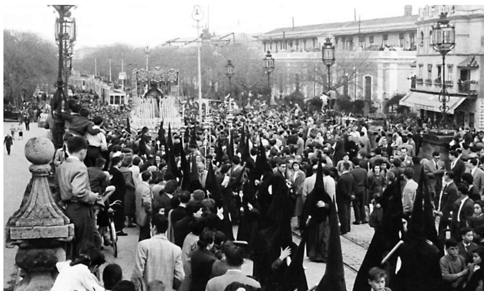
Histórica imagen realizada por el recordado reportero Ángel Gelán, del tránsito de la Cofradía de San Bernardo por el puente de este popular y cofradiero barrio sevillano