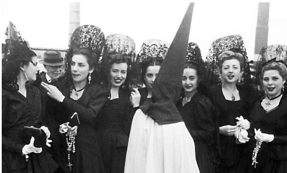
Mantillas en las calles de Sevilla. Jóvenes ataviadas con el clásico atuendo para visitar los Sagrarios de las diferentes parroquias de la ciudad. Estas bellas mujeres lucen esta prenda tradicional para participar además con fe y devoción en la jornada cumbre del Jueves Santo.