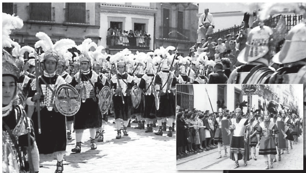
En esta composición figuran la Centuria Romana de la Hermandad de la Macarena y la que forma parte de la Cofradía del Santo Entierro. Son imágenes históricas, pero que sirven para contratar ambas grupos que forman parte de dos instituciones cofrades muy diferentes. Los "armos" del Santo Entierro hasta cambiaron de ropaje en los últimos años.