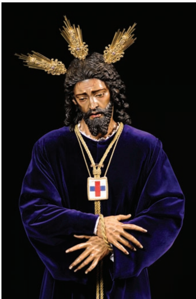
Ntro. Padre Jesús Cautivo y Rescatado. Hermandad San Pablo (Sevilla).

Después de la desamortización de Mendizábal, (1836) vuelve a Sevilla la Orden Trinitaria, en el año 1986, haciéndose cargo de la Parroquia de Ntra. Sra. de las Veredas (Valdezorras), posteriormente de la San Ignacio de Loyola (Polígono San Pablo), de las Capellanías de los Centros Penitenciarios de Sevilla-2 y el Centro de Mujeres de Alcalá de Guadaíra.