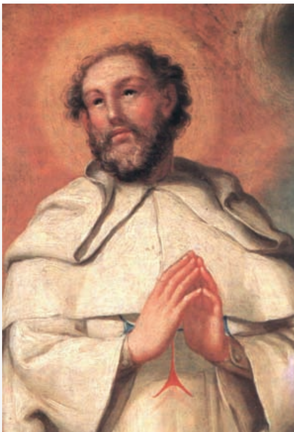
San Juan de Mata

En Valdepeñas (Ciudad Real) se establece la primera comunidad de trinitarios descalzos. Con el breve Ad militantes Ecclesiae (1599) el papa Clemente VIII da