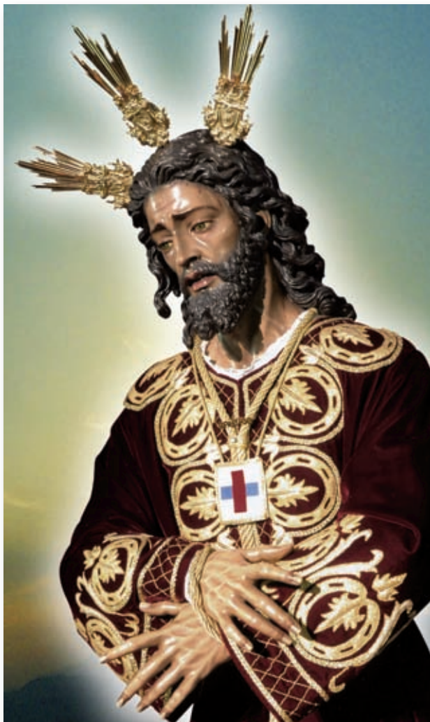
Titular de la Trinitaria Hermandad de Ntro. Padre Jesús Cautivo y Rescatado y Ntra. Sra. del Rosario de Sevilla.

En la actualidad son singularmente notables las imágenes del RESCATADO , además de la de Madrid, puesta a salvo por la Dirección del Patronato Nacional a través de la Embajada Española en Suiza durante la contienda española de 1936 al 1939, las de Córdoba, Alcázar de San Juan, Valdepeñas, Andújar, Villanueva del Arzobispo, Antequera, Algeciras, Algorta, Barcelona y Sevilla, además de un gran número de poblaciones que le vienen dedicando cultos especiales a lo largo de todo el año.