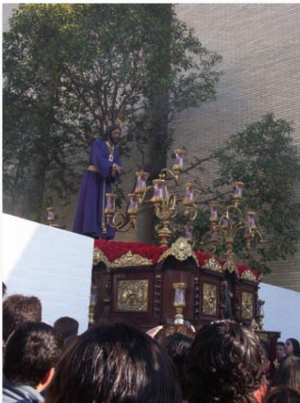
Primera salida Procesional de Ntro. Padre Jesús Cautivo y Rescatado. 4 de abril de 1992.

La Hermandad recibe el título de "TRINITARIA" , por Decreto del Ministro General de la Orden f. José Gamarra Mayor , de fecha 8 de Marzo de 1991 , por su identificación y acogida al carisma y espíritu Trinitario. Siendo comunicado a la Autoridad Eclesiástica Hispalense, quien autoriza su inclusión en el título de la Hermandad.