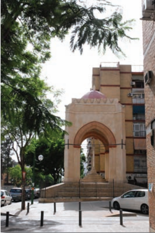
Templo de la Cruz del Campo. Año 1380, lo edificaron los hermanos de la cofradía de negros llamada Nuestra Señora de los Ángeles. Última estación del antaño Vía Crucis de las Hermandades de Sevilla.