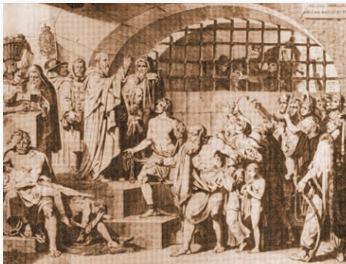
Grabado de la liberación de cautivos por los trinitarios

Situados los españoles en el puerto Mámora, dentro del reino de Fez, en Mauritania, por razones estratégicas, corriendo el año 1614, reinando Felipe III, lo denominaron “Fuerte de San Miguel”, del que dicho arcángel fue su primer Patrón. Entre las imágenes sagradas veneradas