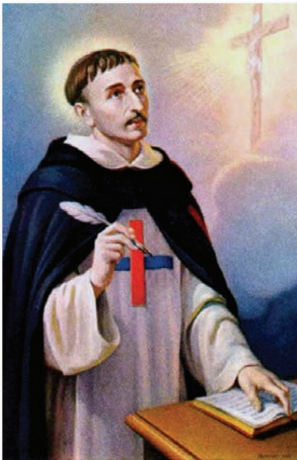
San Juan Bautista de la Concepción