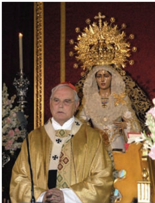
Bendición de Ntra. Sra. del Rosario por S.E.R. Cardenal-Arzbispo de Sevilla, f. Carlos Amigo Vallejo. 3 de octubre de 2007.