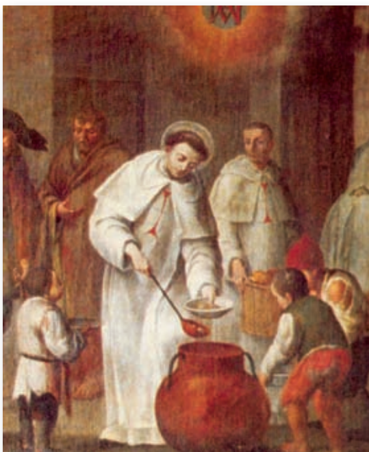
San Simón de Rojas