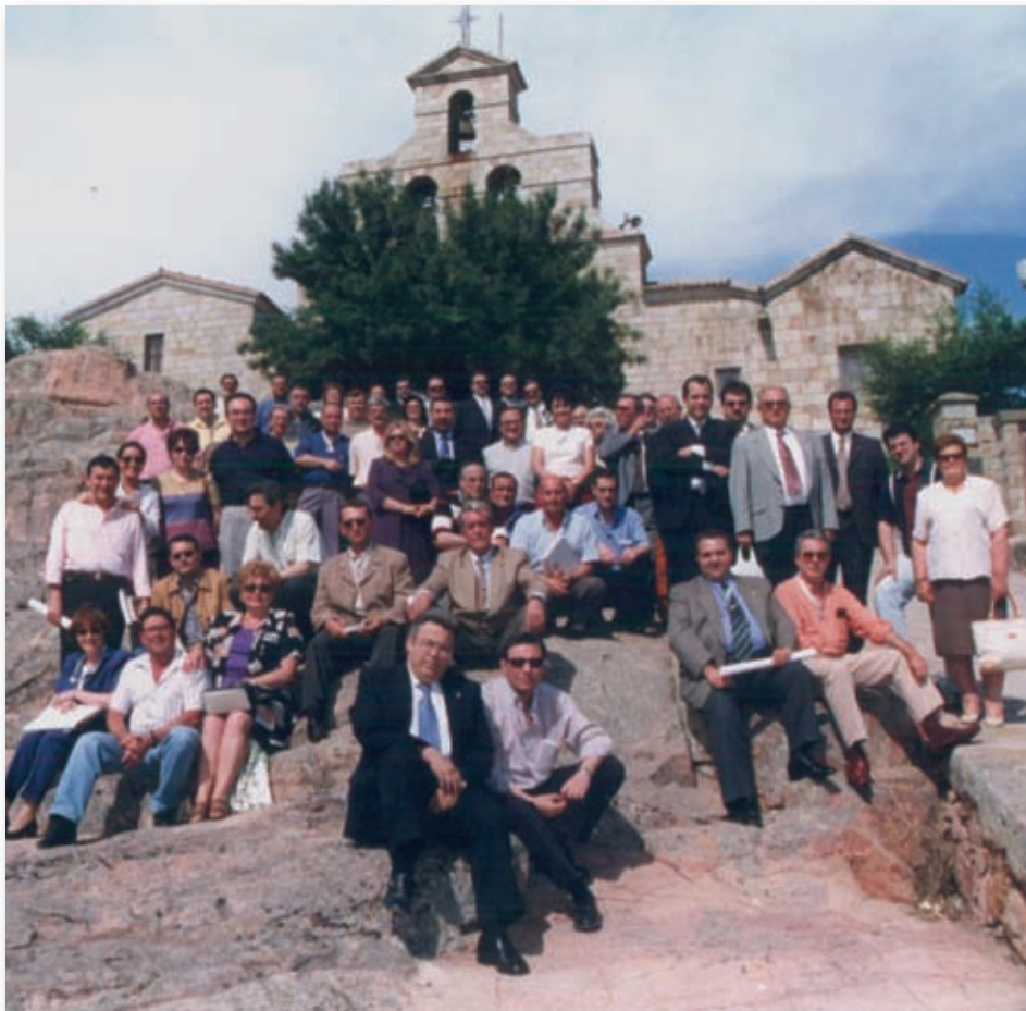
Primer Encuentro Nacional. Santuario de Ntra. Sra. de la Cabeza. Andújar-Jaén. 2000.

- Venerable Esclavitud y Cofradía de Penitencia de Nuestro Padre Jesús Cau- tivo y Rescatado (Medinaceli) y María santísima de los Dolores de la V.O.T. Ser- vita. (Chiclana de la Frontera-Cádiz)