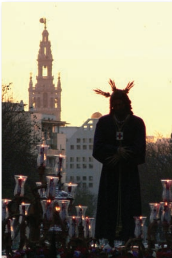
Primera Estación de Penitencia al Templete de la Cruz del Campo vistiendo los hermanos la túnica de nazareno. Año 2006.

El 14 de septiembre de 2005 , se celebra Cabildo General Extraordinario de hermanos, donde se aprueba entre otros puntos, que la Imagen de Ntro. Padre Jesús Cautivo y Rescatado sea acompañada en su paso procesional por las figuras secundarias; Herodes, Caifás, dos romanos y un Sanedríta, aprobando