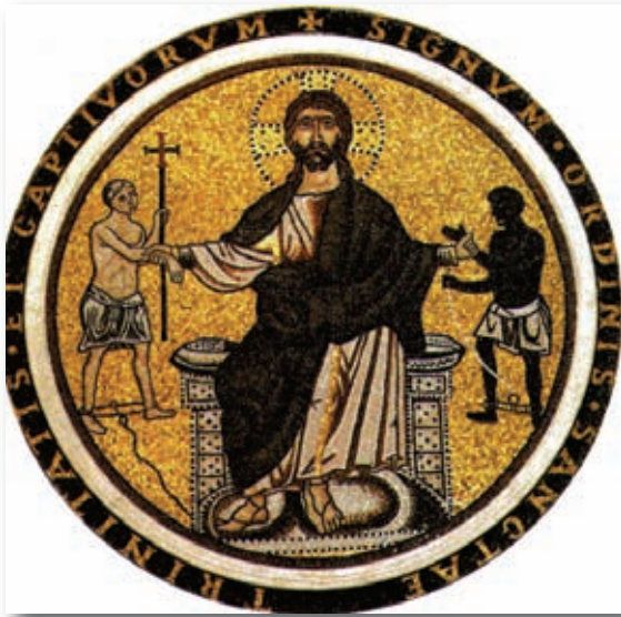
Escudo de la Orden Trinitaria

dención y misericordia. La Santísima Trinidad como fuente de la caridad que se traduce en el servicio de la redención y misericordia: "Gloria a la Trinidad y a los cautivos libertad" .