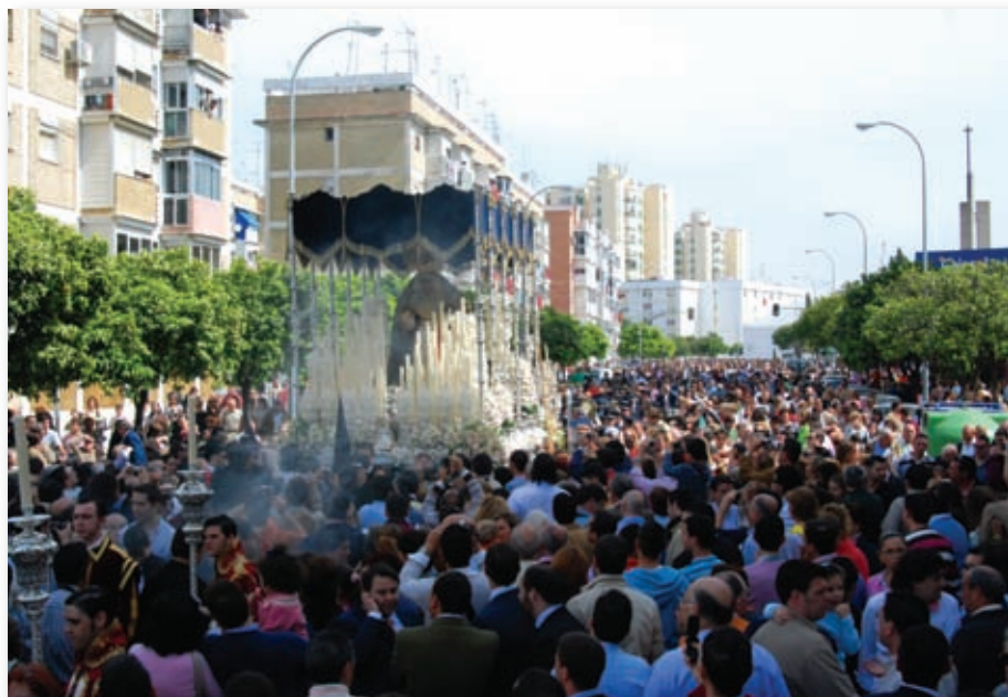
Primera Estación de Penitencia a la Catedral de Sevilla. 17 de marzo de 2008 (Lunes Santo)- Ntra- Sra. del Rosario por su barrio de San Pablo.

rias del Misterio de Ntro. Padre Jesús Cautivo y Rescatado obra de nuestro hermano e imaginero, N.H.D. Luis Álvarez Duarte , en el Salón del Apeadero del Excmo. Ayuntamiento de Sevilla . Las cinco figuras que componen la escenografía del Pasaje Evangélico de San Lucas 23;6-10 junto a la Sagrada Imagen de N.P. Jesús Cautivo y Rescatado estuvieron expuesta durante cuatro días, hasta el día 2 de febrero, con gran asistencia de público, más de 20.500 personas visitaron la exposición (datos del control interno de seguridad del Consistorio)