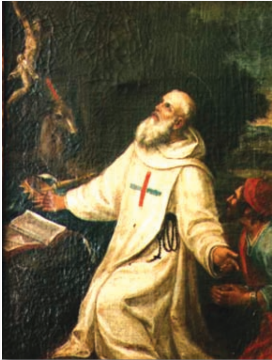
San Félix de Valois

rés en mantener viva la entrega solidaria a los cautivos y a los pobres.