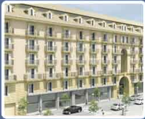
Edificio Trento Esq. Ronda Capuchinos / Salesianos de la Trinidad (Sevilla) INFORMACIÓN Y VENTA 954 53 78 85