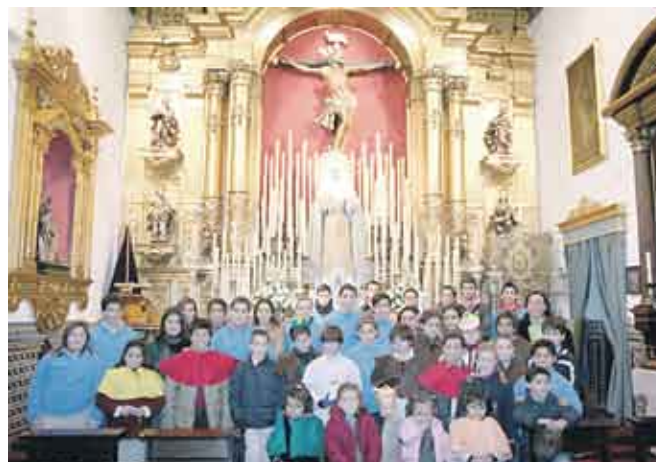
Los voluntarios que formaron en la Operación Carretilla de la Hermandad del Museo, ante el altar con las imágenes titulares.

na, Velázquez – Tetuán, Plaza Nueva, Granada, Plaza de San Francisco. En esta zona se hizo una parada delante del Nacimiento que instaló la propia Cofradía del Lunes Santo. En este lugar, la Agrupación Musical que formó en este cortejo de la Operación Carretilla interpretó diversas marchas. El cortejo, posteriormente, siguió por Sierpes, Campana, Plaza del Duque, Plaza de la Concordia, Virgen de los Buenos Libros, Cardenal Cisneros, Alfaqueque, Goles, Puerta Real, Gravina, Pedro del Toro, Miguel de Carvajal, Pla-