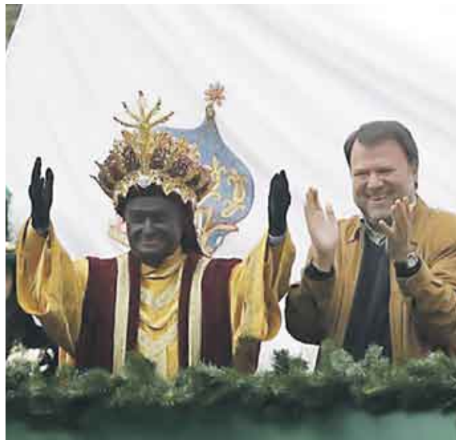
Disfrutó el alcalde de Sevilla, Alfredo Sánchez Monteseirín, con el brillante desarrollo de la fiesta de Reyes Magos.