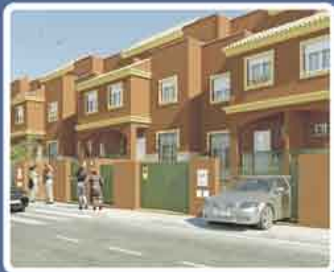
Hacienda La Cartuja Tomares INFORMACIÓN Y VENTA 954 15 16 16