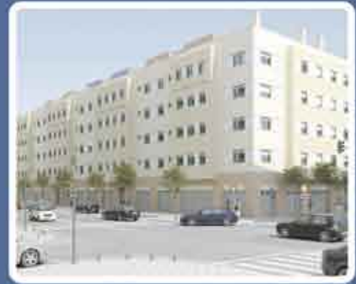
Edificio Bolonia Carretera Carmona (Sevilla) INFORMACIÓN Y VENTA 954 27 95 20