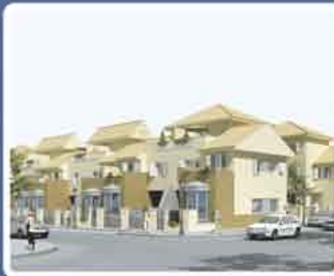
Altos Castilleja Castilleja de la Cuesta INFORMACIÓN Y VENTA 954 16 43 13