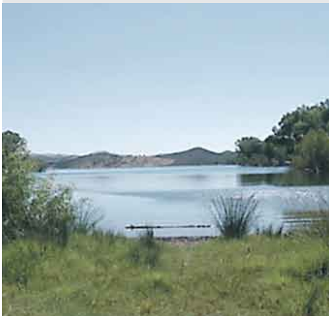
Los embalses de Emasesa garantizan el abastecimiento de agua para tres años.