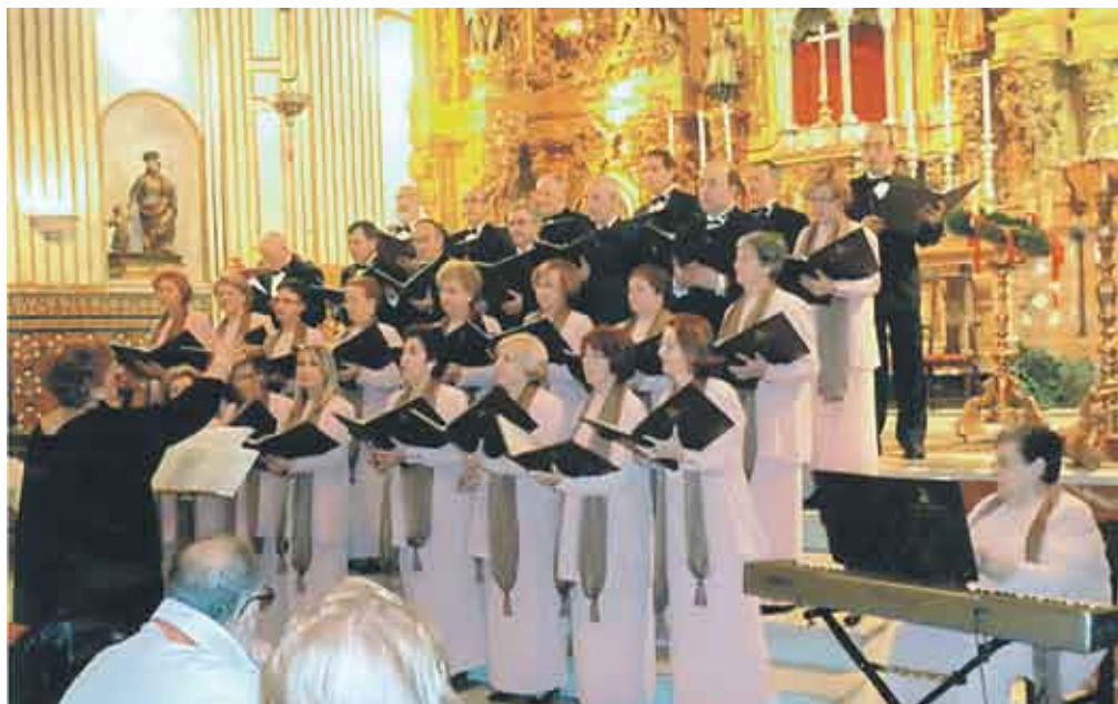
En la Iglesia de San Buenaventura, la Casa de Extremadura celebró un concierto que estuvo a cargo del Orfeón de Cáceres.