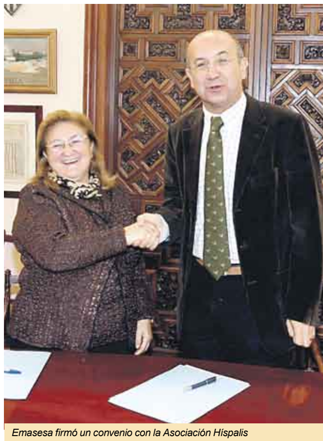
Emasesa firmó un convenio con la Asociación Híspalis

El tiempo de duración del Convenio será de un año, a partir de la fecha de la firma y se entenderá prorrogado por idénticos períodos de tiempo, salvo denuncia expresa por cualquiera de las partes, realizada con una antelación de un mes a la fecha de terminación del período de vigencia inicial o prorrogada.