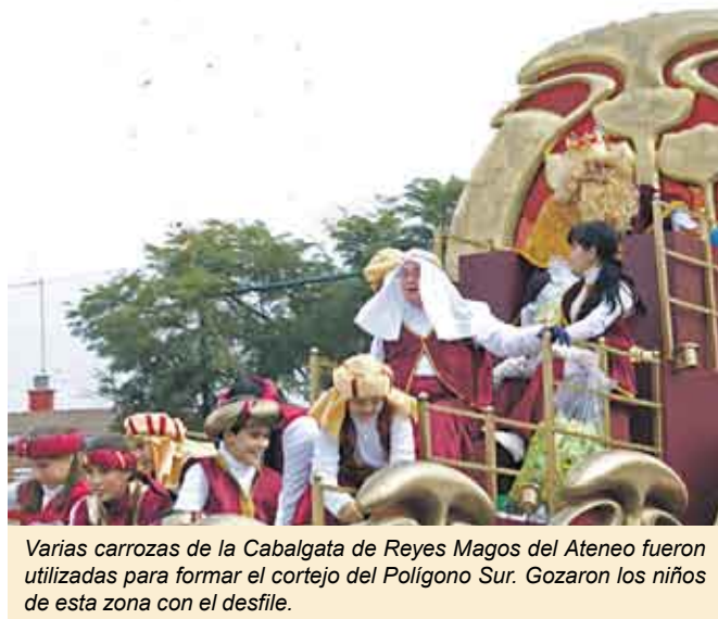
Varias carrozas de la Cabalgata de Reyes Magos del Ateneo fueron utilizadas para formar el cortejo del Polígono Sur. Gozaron los niños de esta zona con el desfile.