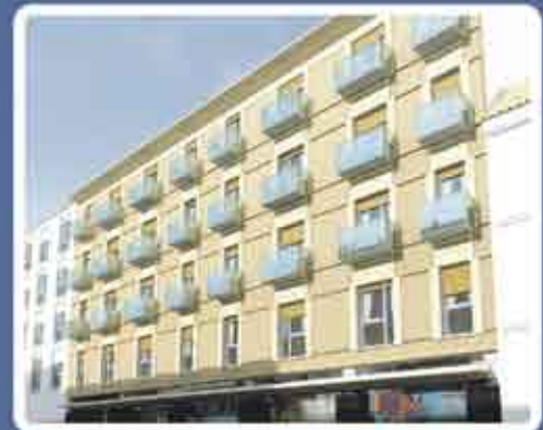
Edificio Toscana Carretera Carmona (Sevilla) INFORMACIÓN Y VENTA 954 53 78 85

¿Dónde te gustaría vivir? En Sevilla o en el Aljarafe, Inmobiliaria del Sur es un valor seguro para tu compra