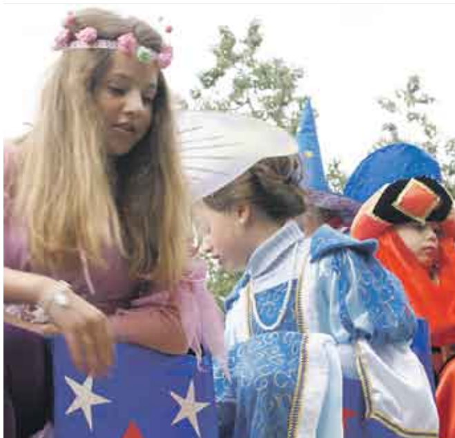
La Asociación la Milagrosa, del barrio de Ciudad Jardín, volvió a recorrer esta zona – con una masiva participación.