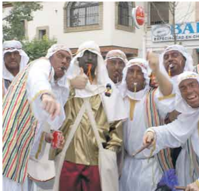
Las Cabalgatas, con sus grupos de beduinos, tienen un enorme poder de convocatoria en los Distritos y en tradicionales instituciones.