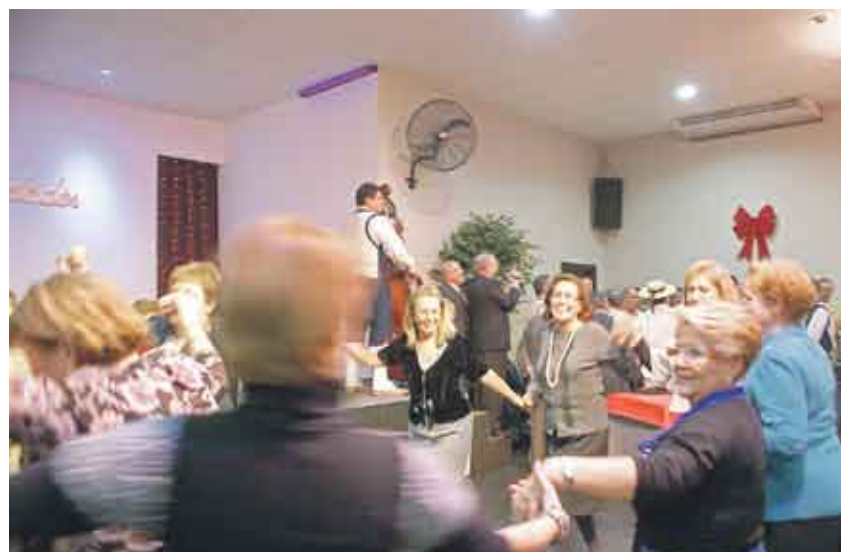
Y al aire de "Lo Divino", la fiesta canaria fue espectacular y entrañable. Jubilosas jornadas de Navidad y Reyes, celebradas por con enorme brillantez por este gran colectivo.