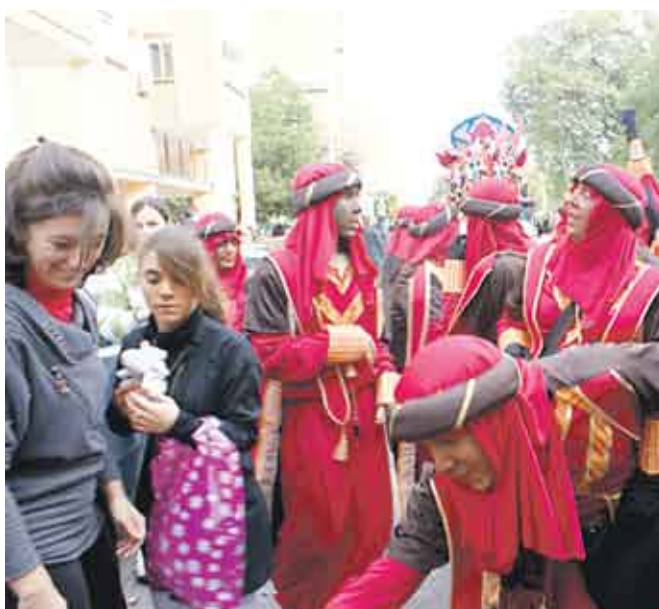
Espectacular recorrido de la Cabalgata de Reyes Magos de San Pablo, que también llegó hasta zonas del Distrito de Nervión.