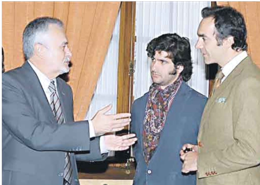
Andalucía respalda la fiesta de los toros. Lo ha dicho el presidente Griñán.

Casi con toda seguridad la sangre de ese “toro” que se lidia en la región de Cataluña, no llegará a los verdaderos tendidos. La Fiesta Nacional, que es tan nuestra, seguirá celebrándose en esas tierras donde, además, nacieron buenos y destacados toreros. Un espejo en el que se pueden mirar esos separatistas catalanes, esos radicales,