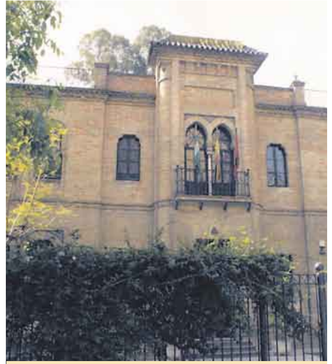
Habrán reconocimientos para los vecinos del Distrito Sur.

Esta junta del mes de diciembre también incluyó la aprobación de una moción del grupo municipal de Izquierda Unida para instar a la delegación competente del Ayuntamiento de Sevilla para que la oficina de correos de la barriada de Martínez Montañés tenga el mismo horario de apertura que el resto de oficinas, ya que actualmente sólo abre de