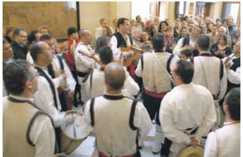
Como es tradicional, hubo concierto de villancicos en la inauguración del belén del Hogar Canario, a cargo de la Rondalla de "Lo Divino", de La Palma.