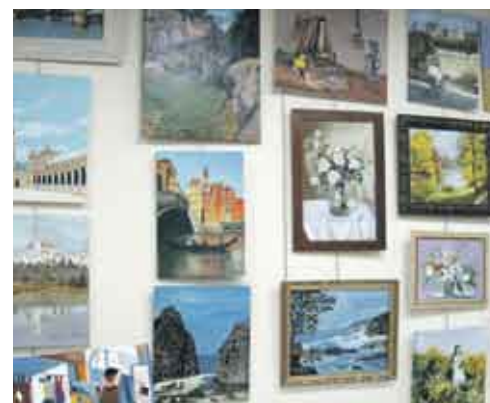
En este curso 2009-2010 se ha superado aún más el nivel de calidad de los trabajos en los Talleres del Distrito Sur.