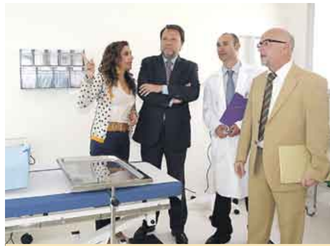
Nuevos centros de salud para los barrios de Sevilla.

Con respecto a los dos centros de salud de Bellavista y Torreblanca serán construidos por Emvivesa. El Ayuntamiento de Sevilla cederá las dos parcelas al SAS, contando con la participación de los vecinos, en la selección de la ubicación final de los centros de salud proyectados. Por su parte, el SAS asume la financiación del centro de Torreblanca, mientras que en colaboración con el Ayuntamiento de Sevilla cofinancia el de Bellavista.