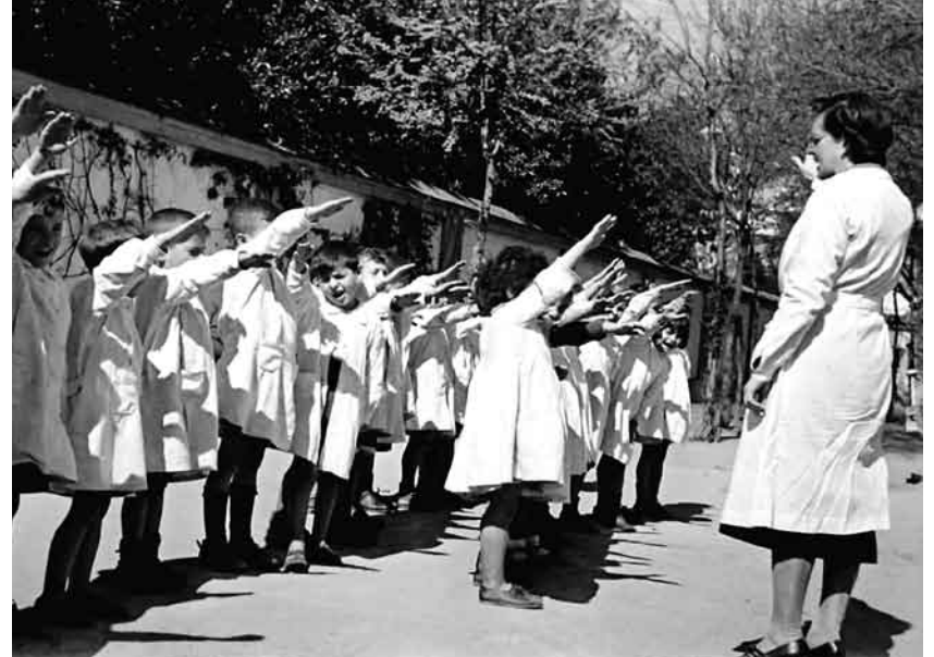
Importantes documentos gráficos realizados por el recordado Ángel Gelán forman parte de la exposición que Comisiones Obreras ha montado en el Cristina.