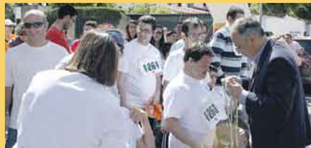
El delegado municipal de Deportes en la competición celebrada en el Centro Educación Especial San Pelayo.