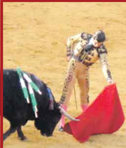
Morante de la Puebla, sin toros de calidad, ofreció talento, arte y belleza.