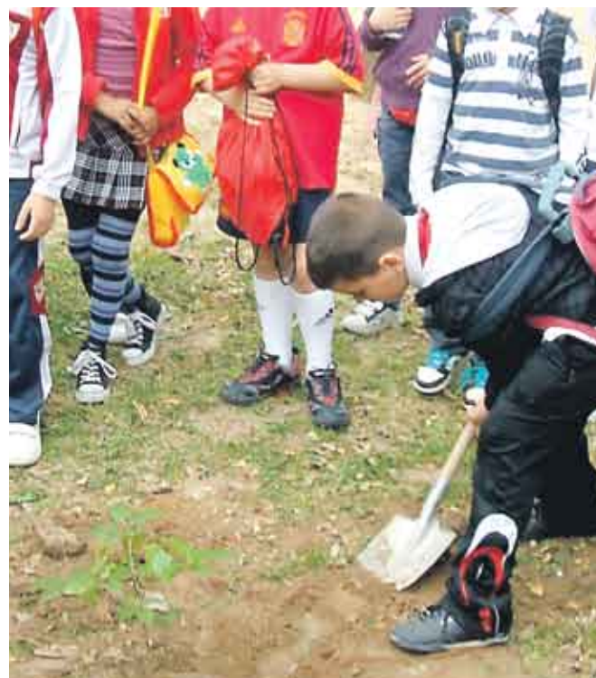
Alumnos del Colegio Almotamid realizaron un programa educativo en la sede de la Asociación Amigos de los Jardines de La Oliva.

Cabe recordar que ambas iniciativas han sido posibles gracias a la modificación presupuestaria —por valor de 2,3 millones de euros— acordada en el Pleno ordinario del mes de febrero. Una decisión que facultó, igualmente, el inicio de la actividad en otros cinco talleres de empleo y en una escuela taller de la ciudad. De este modo, “vuelve a demostrarse con hechos que la lucha contra el paro se sitúa en el primer plano y en el centro de nuestra acción política”, señala el delegado de Economía y Empleo, Carlos Vázquez. Y es que, como ya aseguró entonces el responsable municipal de IU, “ni la crisis ni los recortes presupuestarios derivados de ésta van a afectar lo más mínimo a nuestros dispositivos sociolaborales”.