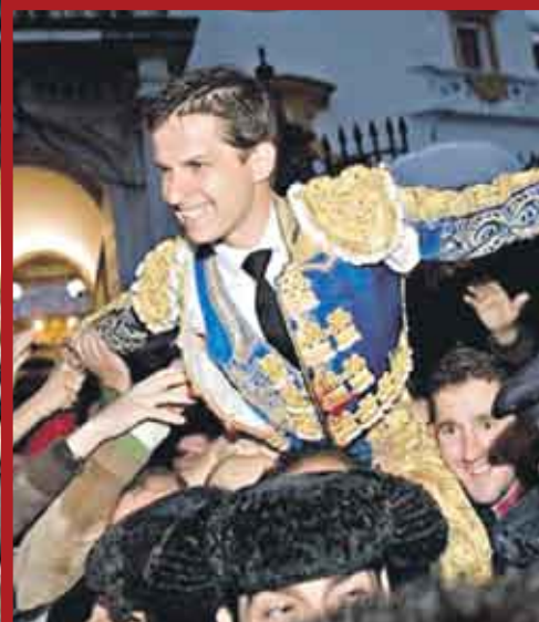
El Juli acaparó casi todos los premios taurinos de la Maestranza.

El pleno de los trofeos taurinos que conceden diversas entidades se lo han llevado "El Juli", pero ninguna de estas entidades se han olvidado de José Mari Manzanares ni de Morante de la Puebla. Sin embargo, hay que meter en este lío a toreros como el jerezano Padilla, El Fundi y