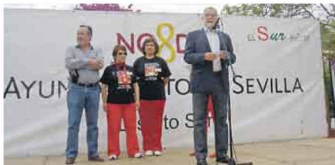
Un momento del acto celebrado en el Celestino Mutis, donde se celebró la I Convivencia de afectados de fibromialgia.

En este mismo sentido se han expresado un médico de familia y dos profesores de Educación Física de la Universidad de Sevilla que han intervenido para recordar los síntomas más habituales y para recomendar los ejercicios más adecuados para contrarrestar el dolor.