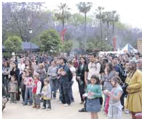
Ambiente espectacular en el Prado de San Sebastián.