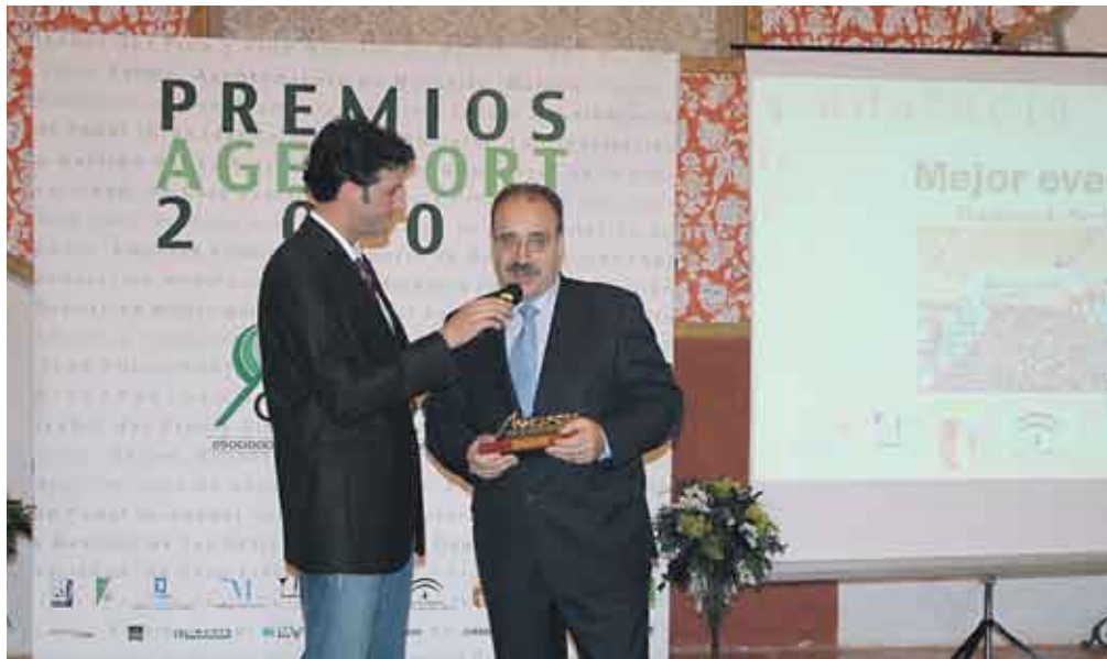
El Maratón de Sevilla recibe el premio al mejor evento deportivo de Andalucía.

Este premio viene a sumarse al reconocimiento que ya obtuvo la XXV Maratón Ciudad de Sevilla de manos de la Federación Española de Atletismo, que lo consideró como el mejor maratón de España, con un total de 967,26 puntos, por delante de Madrid y Barcelona. Esta clasificación valoraba aspectos organizativos como el circuito, la infraestructura organizativa, la atención a los atletas, el servicio médico, las actividades paralelas organizadas, el nivel de control y jueces, etc. Así mismo, también puntuaban las mejores marcas obtenidas en categorías masculina y femenina,