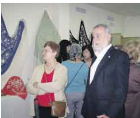
El primer teniente de alcalde y delegado del Distrito Sur comprueba la muestra junto a alumnos y alumnas de los Talleres.