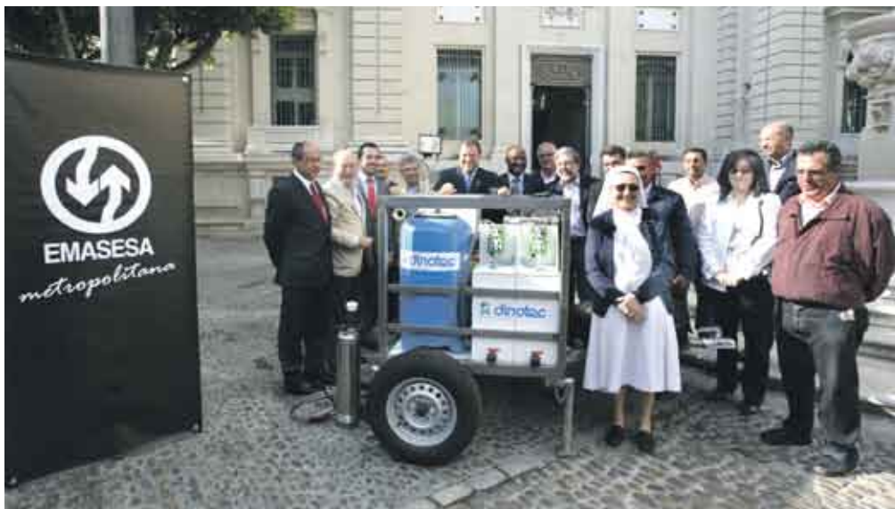
El alcalde hizo entrega de una potabilizadora para Haití.