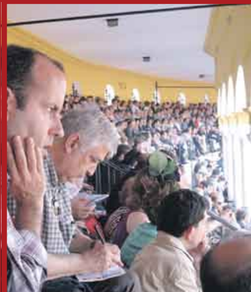
Las obras en las gradas en la Maestranza han sido muy efectivas.