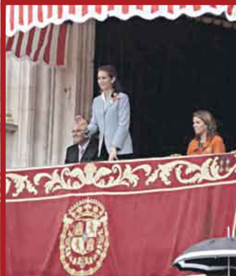
La Infanta Elena presidió una de las corridas de Feria, apoyando la fiesta con su presencia.