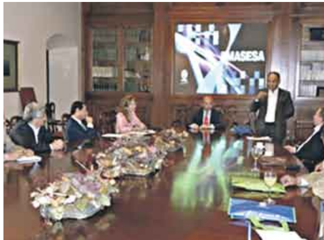
Representantes de Bagdad, Irak y el Banco Mundial en EMASESA.