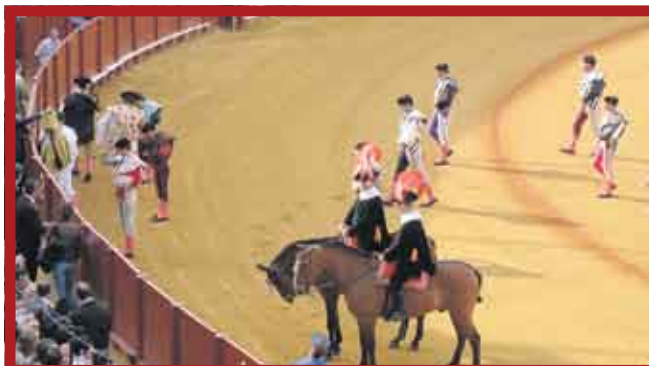
Plaza de Toros de la Real Maestranza.