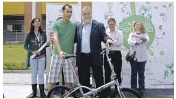
El primer teniente de alcalde en la entrega de premios de la Semana Verde.