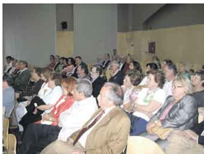
Numerosos almerienses residentes en Sevilla participaron en este primer acto de la IV Semana Grande de Almería en Sevilla.