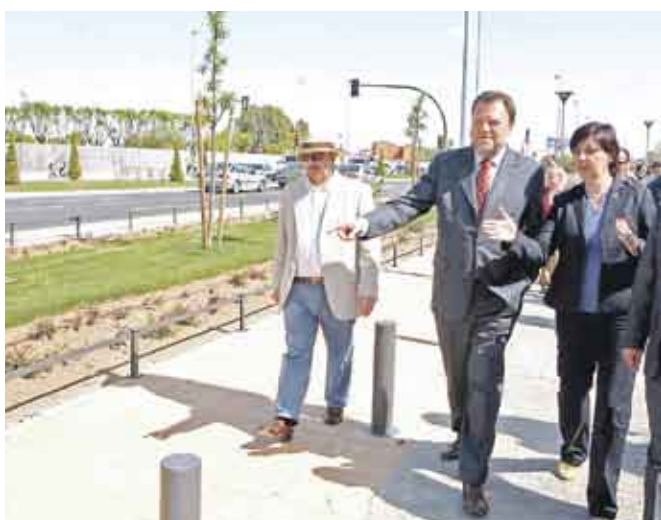
El alcalde y la delegada del Distrito, en el bulevar de Bellavista.