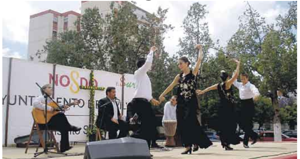
Un instante de la actuación del grupo Arte y Pureza, en la fiesta de la Cruz de Mayo organizada por el Ateneo Popular del Polígono Sur, con la colaboración del Distrito.