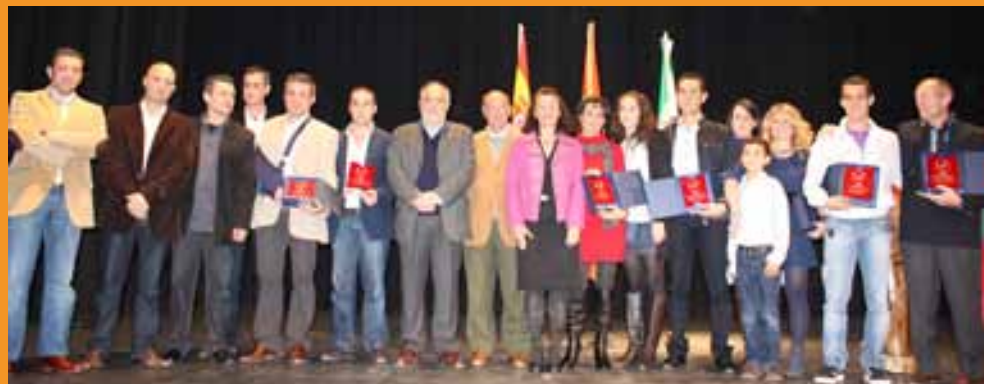
Segunda gala anual de "Los Lentos de Torreblanca".

El Club de Atletismo "Los Lentos de Torreblanca" ha celebrado su II Gala Anual, que ha tenido lugar en el Centro Cívico de Torreblanca, donde se han entregado los premios a los mejores atletas del club en el año 2010 y se han presentado las nuevas secciones deportivas para este año en Duatlón, Triatlón y Montaña.