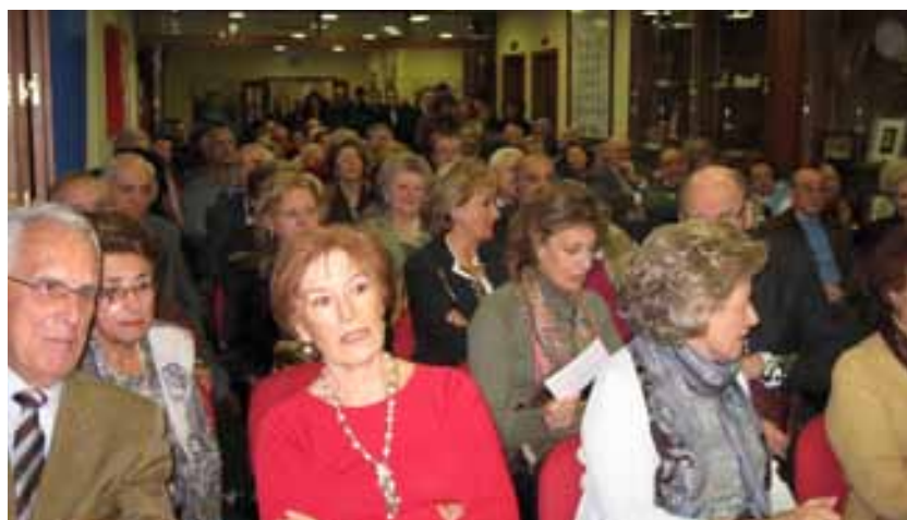
Numerosos socios y socias de la Casa de Castilla y León participaron en los actos de Exaltación del Botillo.