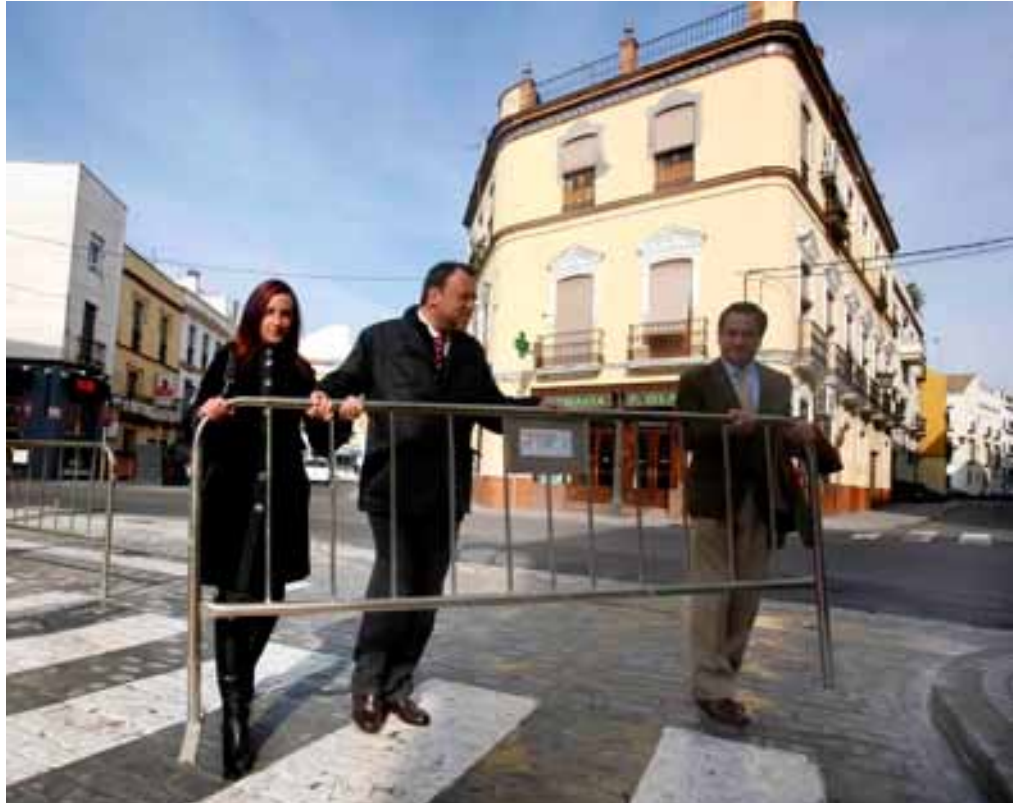
El alcalde, Sánchez Monteseirín, durante su visita a la zona del Muro de los Navarros, en cuya calle se han realizado estas nuevas obras.

Las obras han consistido en la sustitución de los tramos de la red de abastecimiento con la instalación de 476 metros de tubería de fundición dúctil, de diámetros 150mm; 100mm y 200mm; 13 válvulas y 66 acometidas domiciliarias. En la red de saneamiento se han renovado todas las canalizaciones con objeto de mejorar la evacuación de las aguas pluviales y residuales con gres vitrificado, se han instalado 350 metros de tubería, 21 pozos de registro, 25 imbornales y 66 acometidas domiciliarias. Además se han instalado 320 metros de tubería de polietileno para la red de riego y baldeo con agua no potable, que también ha requerido la instalación de 4 válvulas y 5 bocas de riego y se ha renovado la totalidad del pavimento contemplado dentro del ámbito de actuación.