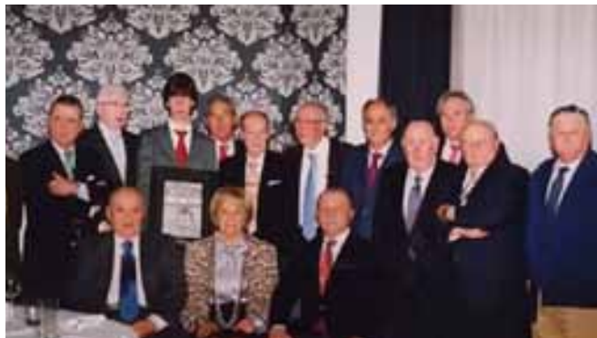
Destacados personajes del mundo de los toros asistieron a la cena organizada por la Tertulia Taurina "Los 13", celebrada en el Hotel Colón de Sevilla.