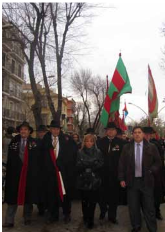
Tradicional desfiles de Pendones de Castilla y León por las calles de Sevilla.

alberga también la Casa de Castilla y León en Sevilla. Se trata de una obra realizada en un local adquirido por los socios de la Casa de Castilla y León en Sevilla, quienes se hicieron cargo de la remodelación, acondicionamiento y equipamiento del centro, por un importe total de 1.080.000 euros. La Junta de Castilla y León ha contribuido aportando parte de la financiación para mobiliario y equipamiento, con una suma de 47.500 euros. El local cuenta con una superficie total de 430 metros cuadrados, todo en una planta en altura de calle, con una fachada de 50 metros. La nueva sede dispone de un salón social, una sala de informática y biblioteca, una oficina de información turística de Castilla y León, despachos administrativos de la entidad y un bar restaurante. Esta Casa Regional de Castilla y León, que se encuentra en la calle Melchor Gallegos de la capital andaluza, se fundó en el año 2006, cuenta con un total de 2.500 socios, agrupando en su Federación Regional a 7 centros regionales asentados