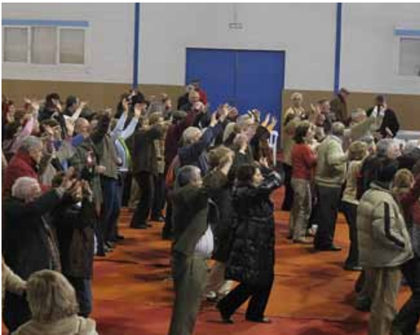
Hubo baile popular en el Pabellón de Deportes de Valencia del Ventoso, con la participación de todos los socios y socias de la Casa de Extremadura que formaron parte de este viaje al pueblo extremeño.