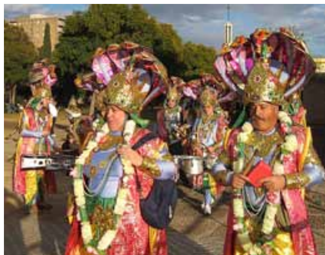
Se promocionaron los Carnavales de Badajoz con espectacular desfile de comparsas y murgas.