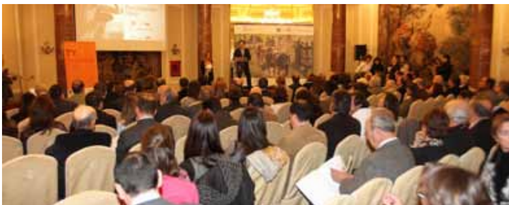
Hubo mucha expectación en el acto de presentación de la Estrategia Turística Territorio-Toro, en la capital de España.

la realidad rural de nuestro territorio y volcarla en un producto turístico que genere un mayor desarrollo para el entorno". Sobre el potencial taurino de Sevilla, explicó que en su territorio hay "150 mil hectáreas dedicadas al toro y 80 fincas ganaderas, siendo una de las provincias pioneras en la cría y selección del toro bravo".