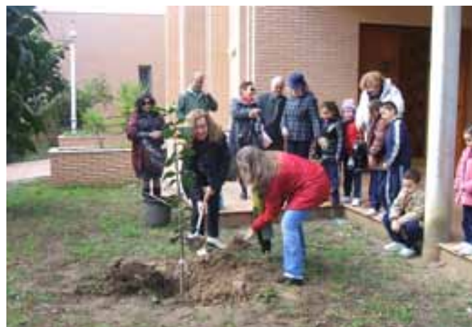
Plantación en la zona ajardinada de la Hermandad del Rocío Sevilla-Sur, el Día de la Paz 2011.

ria y comunicación, taller de radio para la comunidad terapéutica, así como la ampliación de ediciones como nivel 2 de lengua de signos, pintura en óleo o baile de salón. Las nuevas temáticas introducidas surgen de la demanda y sugerencias hechas por los propios usuarios de los talleres. Destacan aquellos que están enfocados tanto a la preparación académica como al bienestar mental de los usuarios.