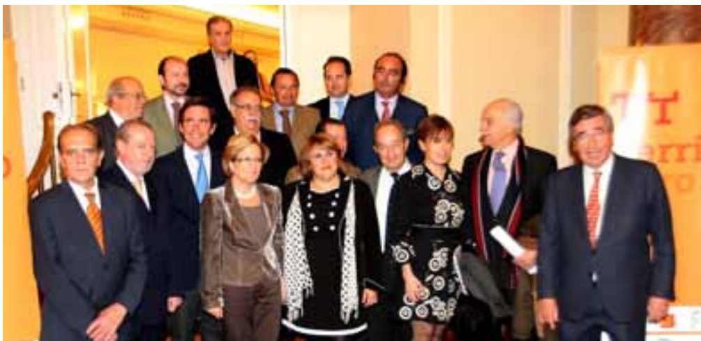
Las Diputaciones de Sevilla, Huelva, Cádiz y Jaén presentaron en Madrid la Estrategia Turística del Toro en Andalucía. Ganaderos y matadores de toros participaron en este acto celebrado en Madrid.

También destacó que "es un mundo rentable porque genera empleo, riqueza y pone en valor entornos naturales protegidos. Territorio toro es una iniciativa dirigida a las ganaderías como elemento vertebrador de la economía y la cultura andaluzas. Tiene mucho de turismo sostenible porque hablamos de aprovechar respetuosamente