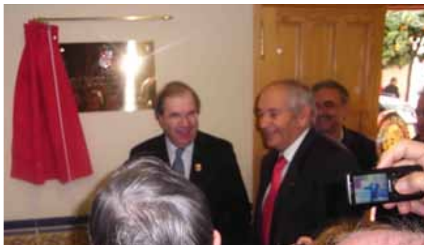
Momento de la inauguración oficial de la Casa de Castilla y León en Sevilla, por Juan Vicente Herrera.