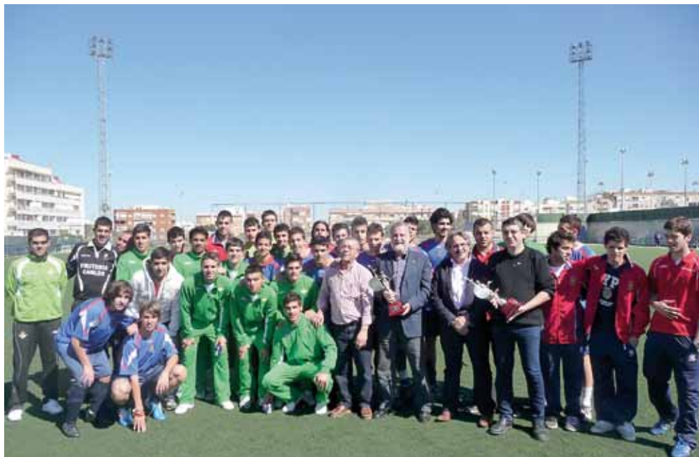
Imagen de familia con los equipos Unión 70 y Real Betis Balompié.