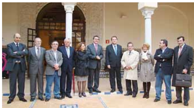
El alcalde de Sevilla, Alfredo Sánchez Monteseirín, presentó el Plan Estratégico 2020, en un acto en el que estuvo presente el candidato socialista a la Alcaldía, Juan Espadas.

ampliación del aeropuerto, la reapertura del auditorio FIBES, la S-40, el avance en el Metro, y más zonas verdes. También se habló en este acto de otras cuestiones relacionadas en este Plan como la Ciudad de la Justicia o la viabilidad de TUSSAM. Acompañó al actual alcalde en esta presentación del Plan Estratégico 2020 el candidato socialista a la Alcaldía, Juan Espadas. Sánchez Monteseirín dijo que "él será quien lleve a buen puerto todos estos proyectos".