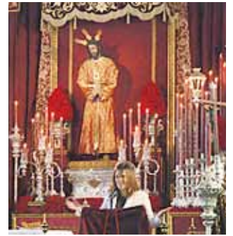
Pregón de San Pablo.