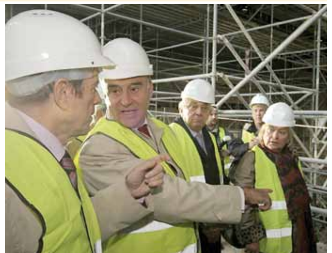
Visita de empresarios del sector turístico al Palacio de Congresos.

Respecto a los congresos que se celebrarán en el nuevo Palacio de Congresos, la delegada y Presidenta del Convention Bureau ha asegurado que existen una serie de congresos ya comprometidos para el segundo semestre del año que posiblemente puedan celebrarse en este espacio.