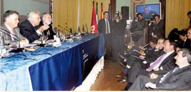
Felipe González intervino en el Congreso Notarial Español, celebrado en Sevilla. El ex presidente del Gobierno estuvo acompañado en el acto por del alcalde, Sánchez Monteseirín.