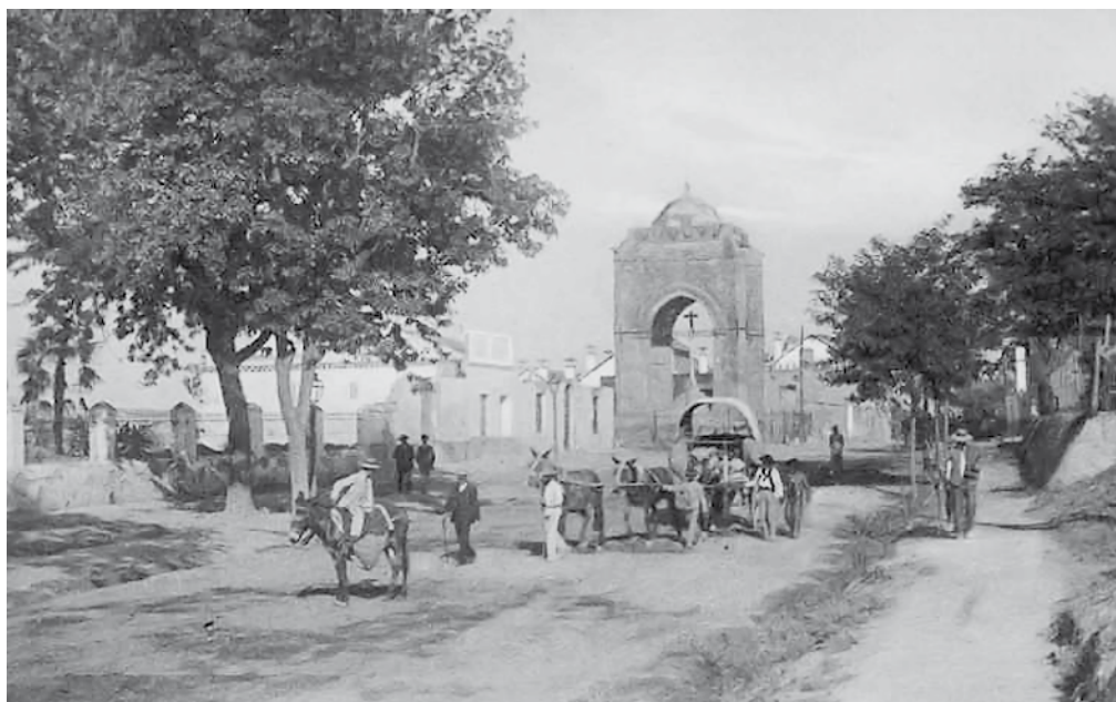
Cien años cumple el barrio de Nervión, aunque hay históricas señas de identidad que tienen sus orígenes en siglos pasados, como el Templete de la Cruz del Campo, erigido en 1521 por el Marqués de Tarifa y que fue el origen de la creación de la Semana Santa sevillana.

En este barrio de envión hay que destacar el monumento del Templete de la Cruz del Campo, erigido en 1521; los restos de los famosos Caños de Carmona; los Jardines árabes de la Buhaira y las centenarias sociedades del Sevilla F.C. y la Fábrica de Cervezas de la Cruz del Campo.