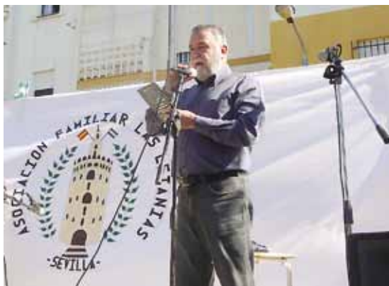
Placa recibida en la Asociación Familiar de las Letanías.