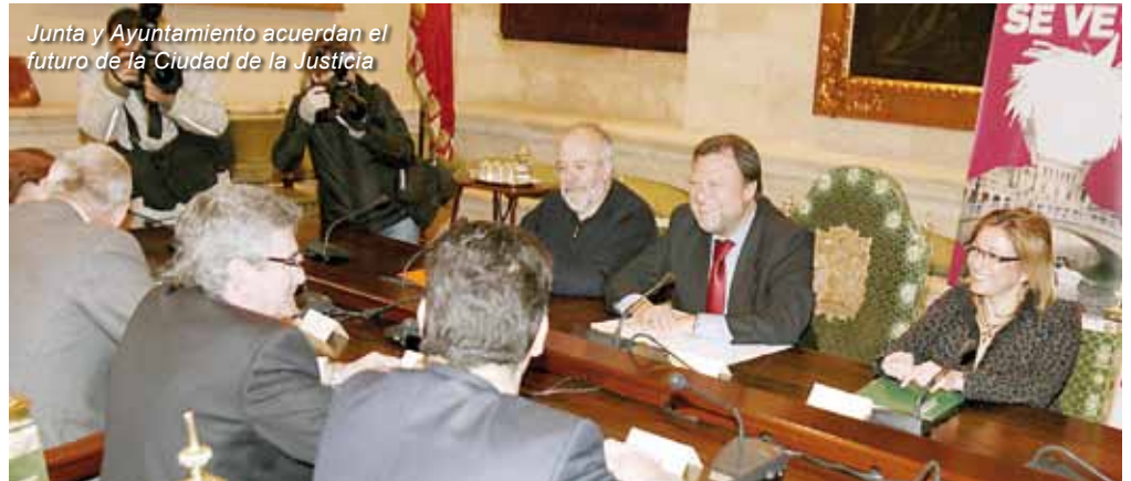
Junta y Ayuntamiento acuerdan el futuro de la Ciudad de la Justicia

dos los órganos y servicios judiciales existentes en la capital hispalense en un único espacio, con las instalaciones del Instituto de Medicina Legal, las salas del Tribunal Superior de Justicia de Andalucía con sede en Sevilla, así como las correspondientes a la Audiencia Provincial de Sevilla y a los distintos órganos unipersonales de las jurisdicciones de lo Penal, Civil y Mercantil, Social y Contencioso-Administrativa.