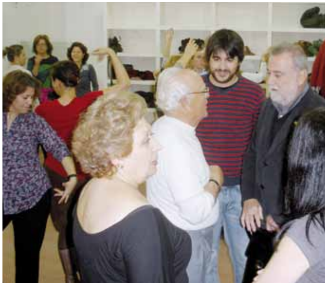
Rodrigo Torrijos realizó visitas a los Talleres Socioculturales y de Empleo del Polígono Sur.

Por otra parte, Torrijos clausuró recientemente el Taller de Empleo de Dinamización Comunitaria del Polígono Sur, en el que recibieron formación un total de 24 alumnos. El primer teniente de alcalde afirmó que "estamos ante un dispositivo de inserción laboral eficaz y efectivo".