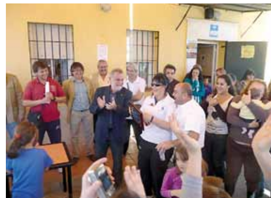
Entrega de los premios a los ganadores del concurso organizado por Solidaridad.