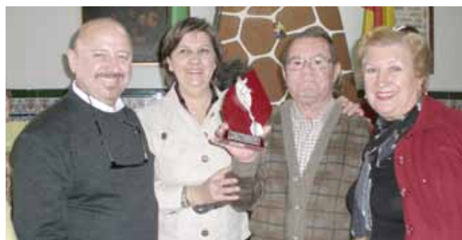
La delegada, entregado los trofeos en la barriada de Pedro Salvador.