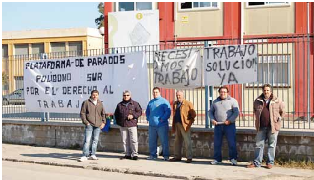
La plataforma de parados del Polígono Sur exige que se solucionen las demandas de puestos de trabajo para los vecinos sin empleo en esta zona.