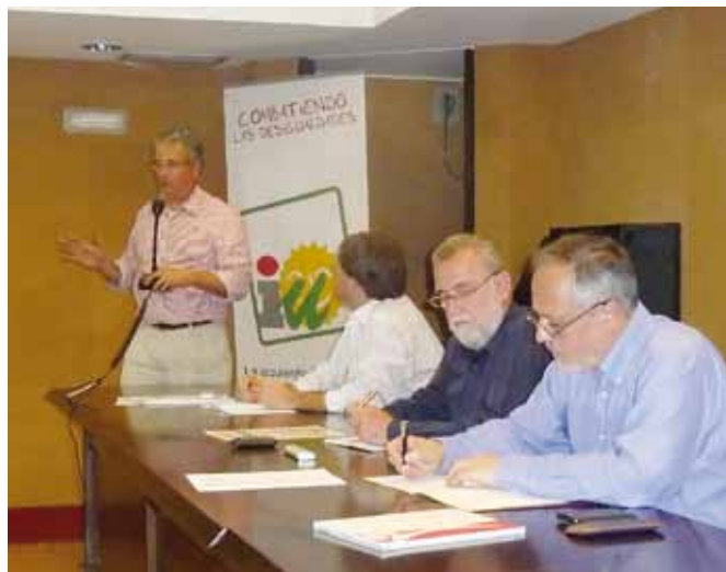
Torrijos informó de las nuevas instalaciones deportivas en los barrios y del fomento de actividades deportivas del programa de IU.