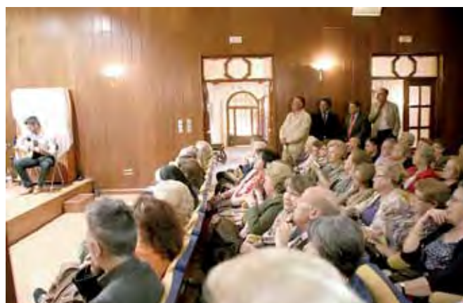
Hubo gran concurrencia en este acto del Grupo Literario San Fernando.