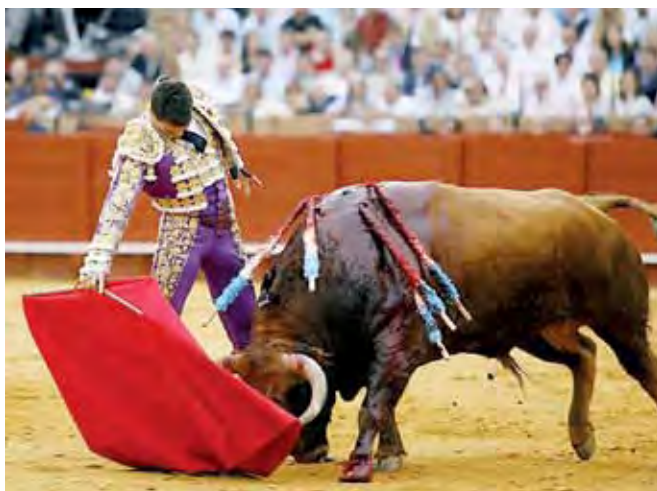
Manzanares, durante su actuación en la Maestranza.

como el máximo triunfador de la Feria 2011, y por la ganadería de Núñez del Cuvillo y el debatido indulto del toro "Arrojado". En el jurado de los premios que otorga la Real Maestranza de Caballería de Sevilla tomaron parte más de 40 personas, entre críticos, representantes de asociaciones taurinas, expertos aficionados y miembros del propio organismo que, como se sabe, preside como hermano mayor el Rey de España, don Juan Carlos. Estos han sido los grandes premios taurinos de la Feria: