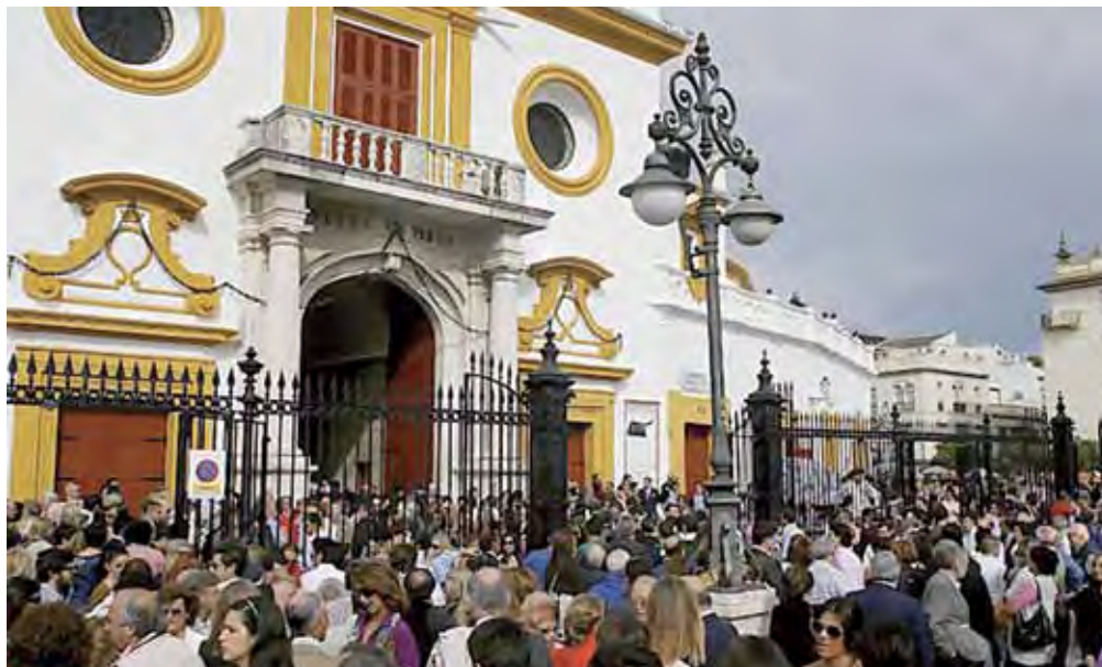
Los estudiantes pueden acceder de forma gratuita a la Plaza de Toros de la Real Maestranza en las novilladas de los meses de mayo y junio.

La Empresa indicará la puerta donde tendrán que personarse los alumnos y los profesores que les acompañen el día del festejo, como mínimo media hora antes del comienzo.