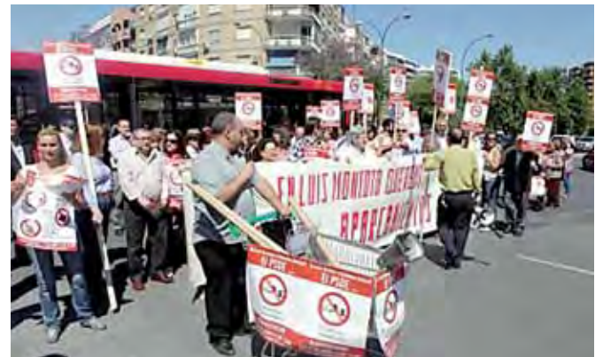
En el Distrito de Nervión se entregaron escritos de protestas por la falta de respuesta del Ayuntamiento.

descarga. Por otro parte, los comerciantes también han acordado solicitar los servicios de un arquitecto urbanista para