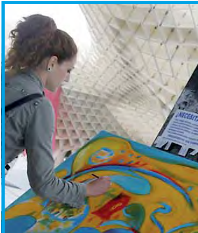
La V Edición del concurso de pintura "Mírate", se celebró en el entorno del Metropol-Parasol

El Observatorio de Comunicación Interna e Identidad Corporativa fue creado por Inforpress, la revista Capital Humano y el IE Business School en el año 2003 con el afán de profundizar en las características de la comunicación interna, como herramienta generadora de transmisión de valores, identidad corporativa, cultura y gestión de marca interna.