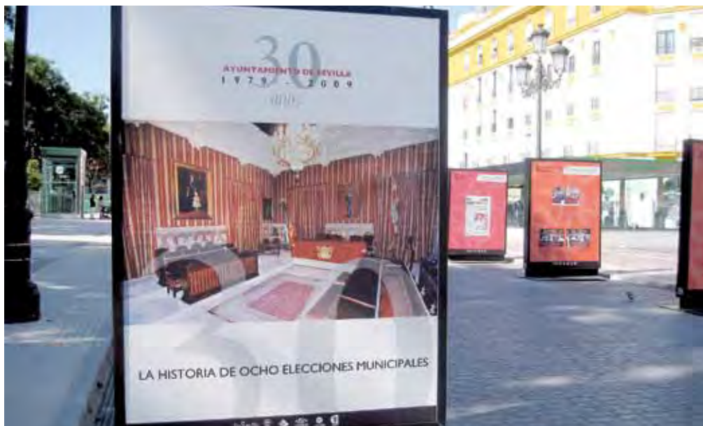
El pasado año se instaló en el Cristina una exposición sobre los 30 años del Ayuntamiento en esta última etapa democrática, con la historia de las ocho últimas elecciones municipales. El día 22 de mayo se celebrarán los novenos comicios locales desde 1979. Hay expectación por conocer quien saldrá elegido para dirigir la "novena sinfonía" de la nueva Corporación Local.

Como en las tertulas que salen al redondel de la Plaza de Toros de la Real Maestranza en los días de corrida, los tres candidatos de los partidos que tienen actualmente mayor representación municipal, también han aparecido juntos en los debates que se han desarrollado hasta ahora ante las cámaras de televisión. Ya hicieron sus primeras faenas en la "tele" municipal, pero ninguno llegó a cortar orejas y rabo en esta primera actuación. La última aparición en la "tele" de los tres candidatos más representativos del panorama político municipal --Espadas,