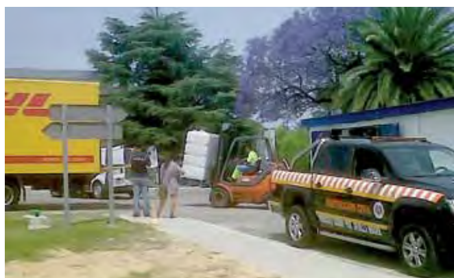
Emasesa ha enviado a Lorca quince mil brick de agua envasada de medio litro para los damnificados por el seísmo.

La delegación de Convivencia y Seguridad, que dirige Alfonso Mir, ultimó los preparativos de una expedición que partió en la mañana del pasado jueves hacia Lorca, con la finalidad, dado cumplimiento al deseo expresado por el alcalde de Sevilla, Alfredo Sánchez Monteseirín, de hacer entrega de diverso material solicitado por el Ayuntamiento de Lorca con destino a los damnificados por el terremoto ocurrido el pasado miércoles en el municipio murciano. La delegación de Convivencia y Seguridad desplazó hasta Lorca, en dos expediciones, a un total de 15 efectivos entre CECOP; Protección Civil; Bomberos, un arquitecto de la Gerencia de Urbanismo, y per-