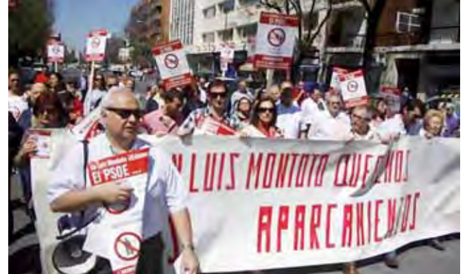
La concentración y corte de tráfico de comerciantes y vecinos de Luis Montoto el pasado 27 de abril.

Los comerciantes y vecinos de Luis Montoto exhibieron numerosa cartelería durante su recorrido de protesta por esta zona del Distrito de Nervión. Cuando los manifestantes llegaron a la sede del organismo municipal realizaron una entrega simbólica de llaves de los negocios. También registraron en el Distrito todas las peticiones, que pasan por restaurar el doble sentido de circulación desde los Caños de Carmona hasta la Ronda del Tamarguillo, mantener las plazas de aparcamiento que se eliminarían con la actuación -estiman la desaparición de 386 y la permanencia de sólo 91- y la implantación de la zona azul en el entorno comercial, "el tercero de Sevilla", lo que evitaría la doble fila y crearía nuevos puestos de trabajo; también reclaman un mayor control de las zonas de carga y