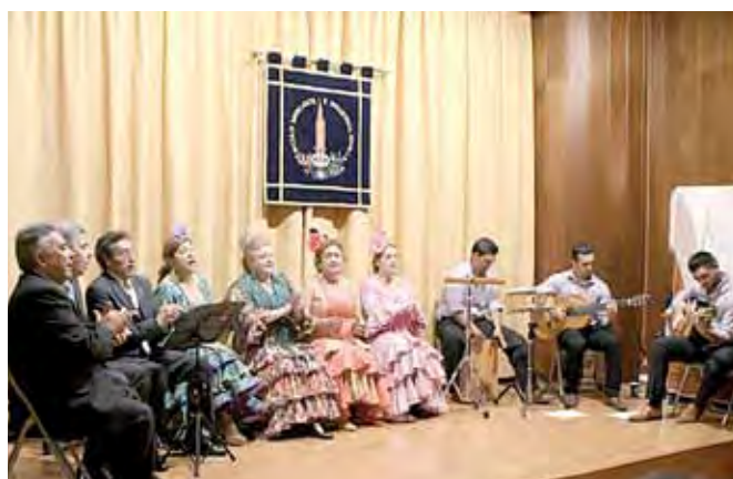
Se estrenó un disco con sevillanas dedicadas a la Duquesa de Alba.