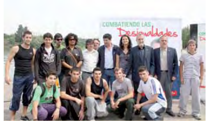
Los candidatos miran hacia el río y su entorno.

Exposiciones artísticas, con carácter permanente o temporal, se instalarán en las márgenes