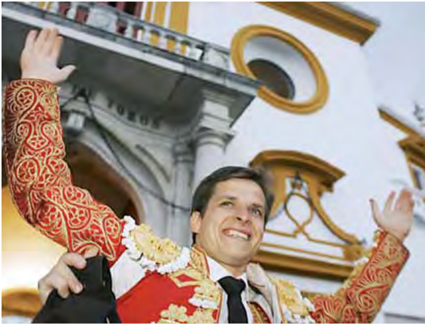
“El Juli” salió por la Puerta del Príncipe tras su actuación en la sexta corrida de abono. Cortó tres orejas en la Feria y dos en la corrida del Domingo de Pascua. Sin embargo, el torero madrileño no ha logrado ningún premio taurino este año 2011.