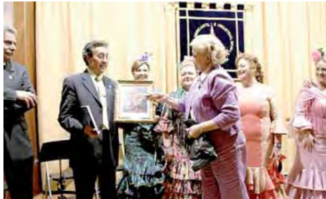
Entrega de una foto enmarcada de San Fernando al Grupo "Abanico", que realizó un brillante actuación en Mercantil.