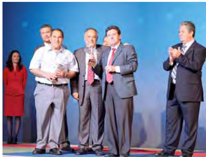
También hubo galardones para los jugadores sevillanos Jesús Navas (Sevilla F.C.); Carlos Marchena (Villareal) y Sergio Ramos (Real Madrid), Campeones del Mundo de Fútbol en Sudáfrica.